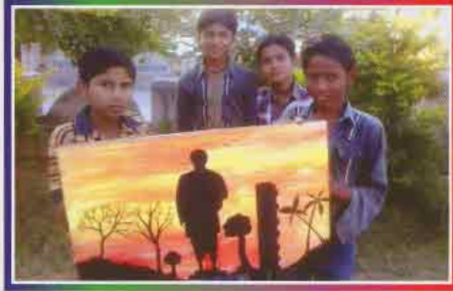
સરદાર બાળમેળો ખીરી પ્રાથમિક શાળા, તા. જોડીયા, જિ. જામનગર