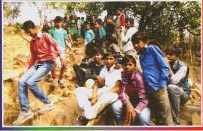
પ્રાકૃતિક શિબિર ખેડ આદર્શ પ્રાથમિક શાળા, તા. હિંમતનગર, જિ. સાબરકાંઠા