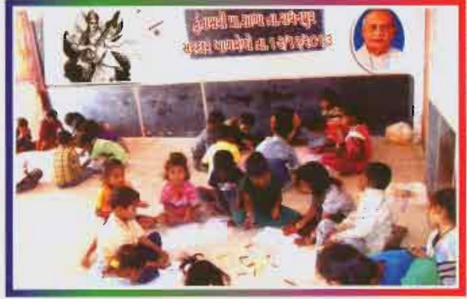
સરદાર બાળમેળો બિલોદરા પ્રાથમિક શાળા નં. ૨, તા. માણસા, જિ. ગાંધીનગર